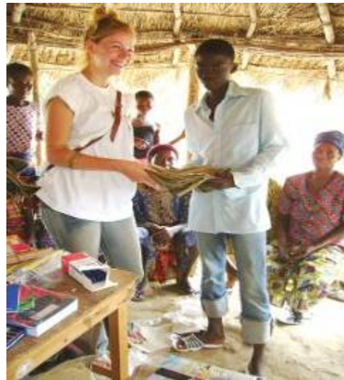
Remise des fournitures aux enfants par un membre de Le RONIER France