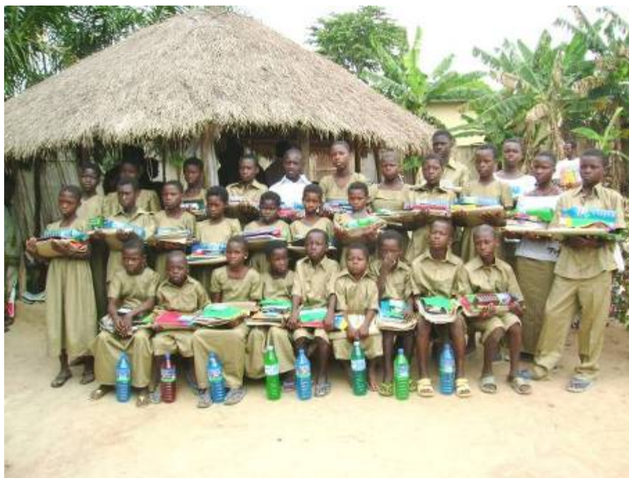
Enfants FES de HAVE à la rentrée 2008-2009