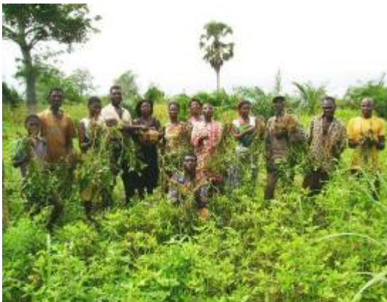
Récolte d'arachide au champ FES de Hové