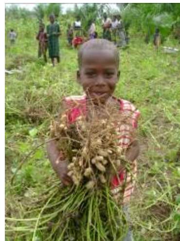
Enfant FES fier de visiter le champ à la récolte.