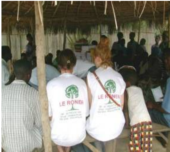
Séance de sensibilisation avant la remise des fournitures