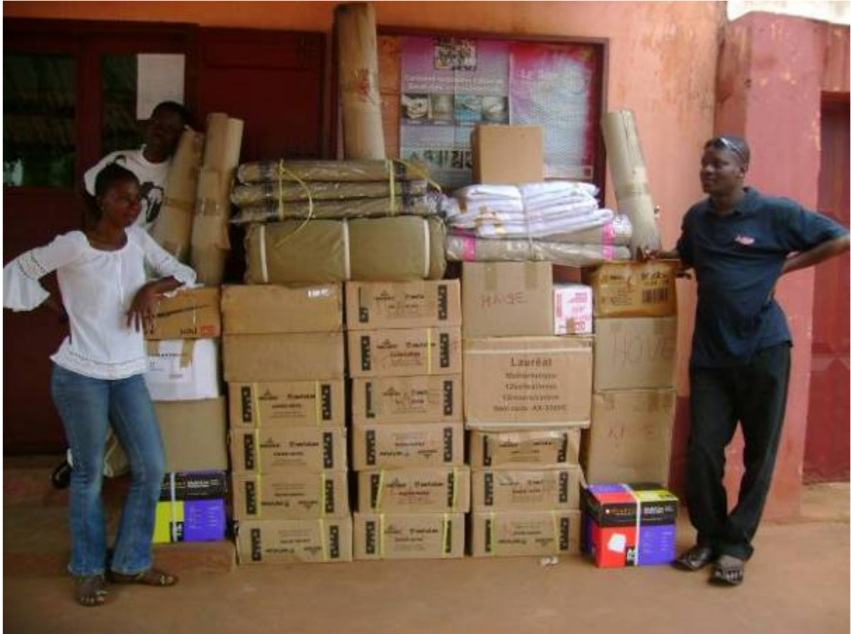
Débarquement des premiers achats de fournitures scolaires pour les enfants FES de Havé et de Hové devant le siège de Le RONIER.

Le problème de la non scolarisation des enfants, principalement en milieux ruraux est un problème de pauvreté. Pour permettre aux tuteurs FES de s'auto suffire, le programme Fonds Enfant Soleil (FES) prends en charges les fournitures et tenues scolaires pour les 120 enfants pour sa phase pilote.