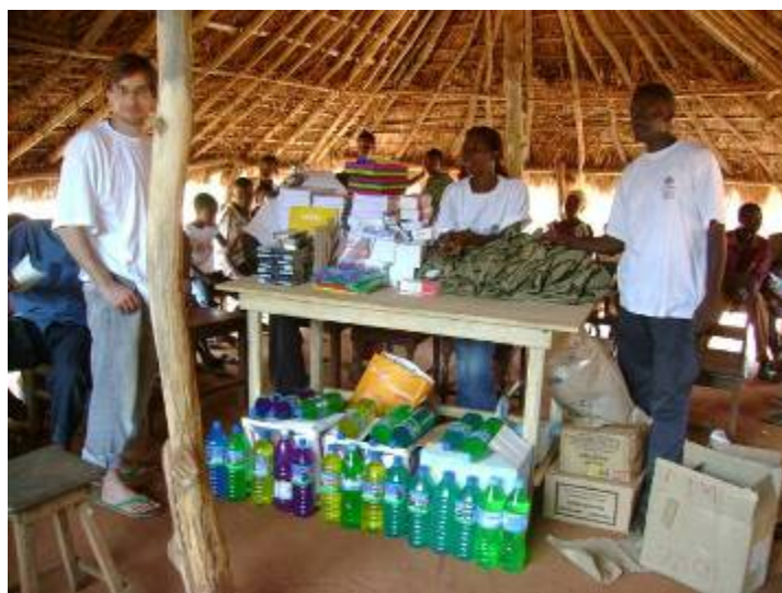
Répartition des fournitures dans le village de Hové.