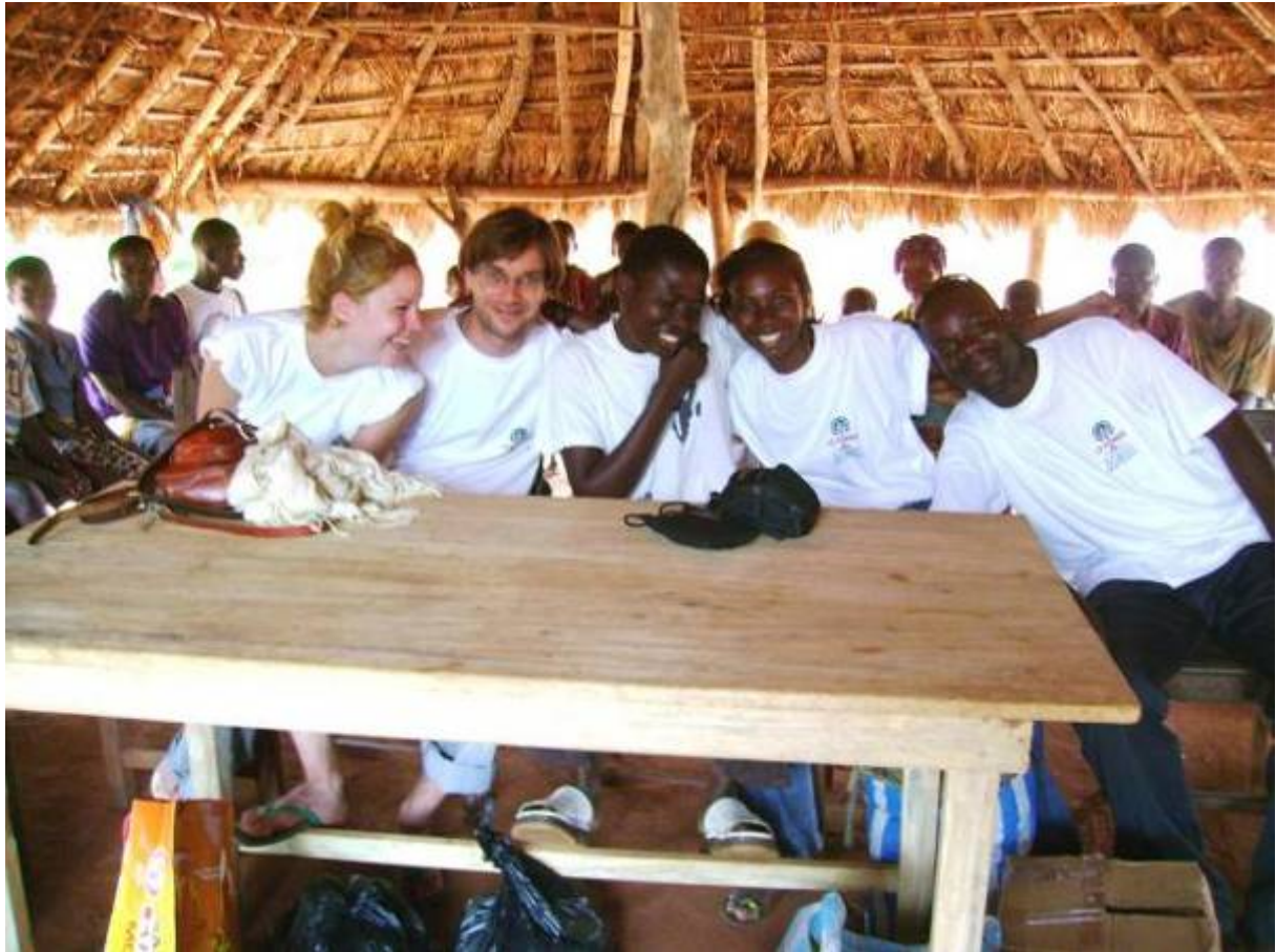
Vue de la fin de la remise des fournitures aux enfants FES

Autorités en charge de l'éducation, autorités traditionnelles et religieuses, comités des parents d'élèves, enseignants comités et tuteurs des enfants FES, bref toute la communauté des trois villages FES est très ravie de l'initiative FES considérée comme une assurance de la scolarisation des enfants en difficultés des milieux ruraux pauvres. A cela s'ajoute la joie de l'équipe de Le RONIER pour leur mission d'appui et de guidage durant les deux ans de la phase pilote de l'initiative FES née le 16 juin 2006 à Kpomé.