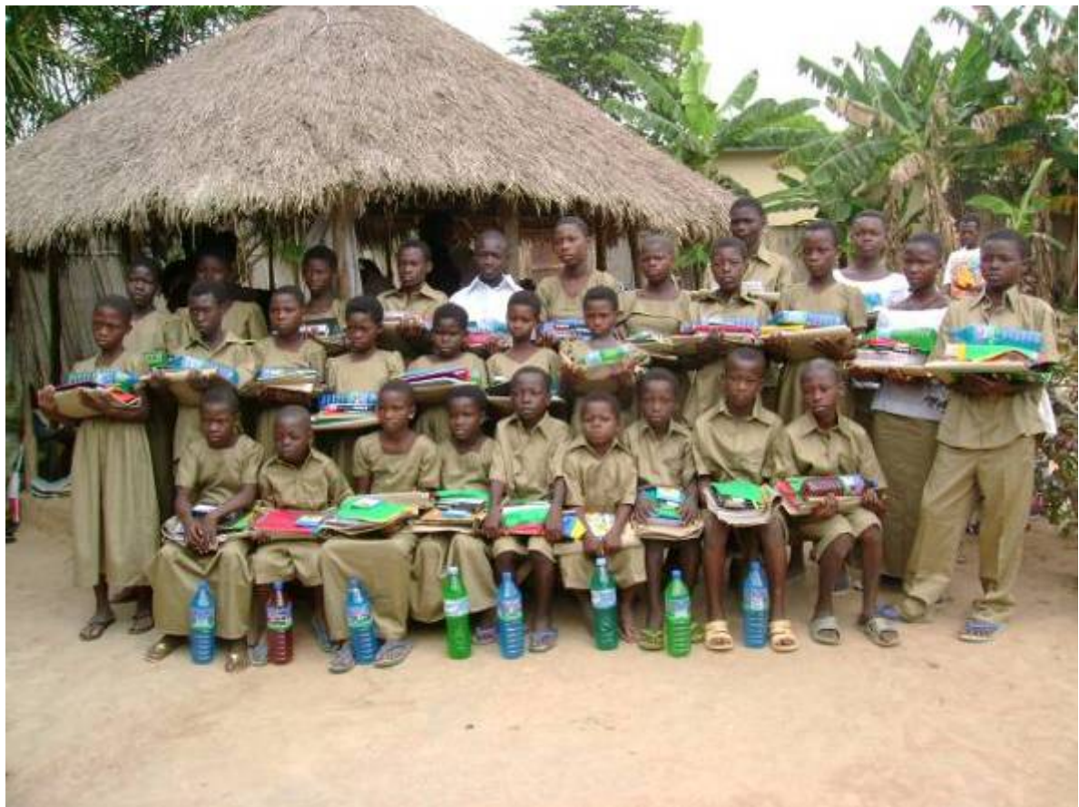
Les enfants FES de Havé habillés et équipés à la entrée pour l'année Scolaire 2008-2009