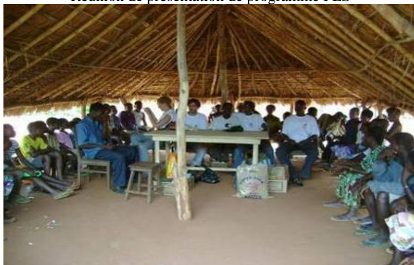
Sensibilisation des comités FES et des autorités traditionnelles avant la remise des outils scolaires aux enfants FES