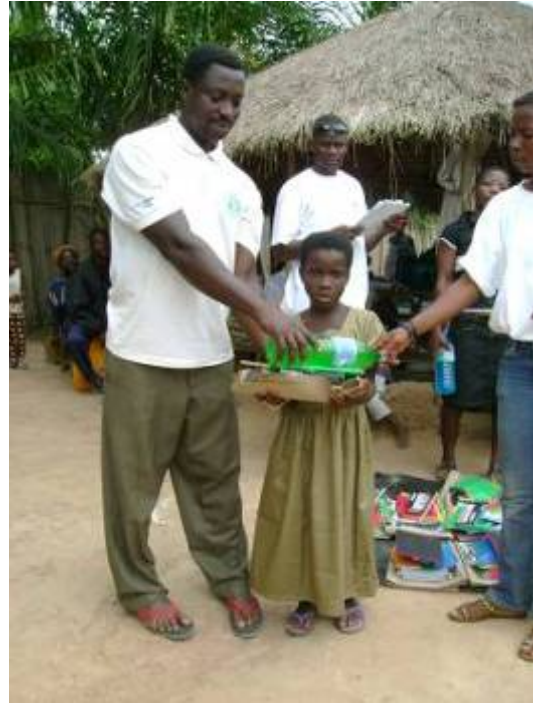
Remise de fourniture par le Président du Comité FES de Havé