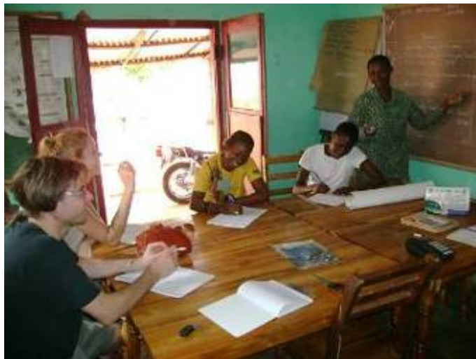
Réunion de présentation de programme FES

En amont à la remise des outils scolaires aux enfants FES, il y a eu des réunions préparatoires et des séances de sensibilisation sur l'approche FES et sur les obligations des comités et tuteurs à entretenir la dynamique communautaire pour acquérir au plus vite une autonomie financière.