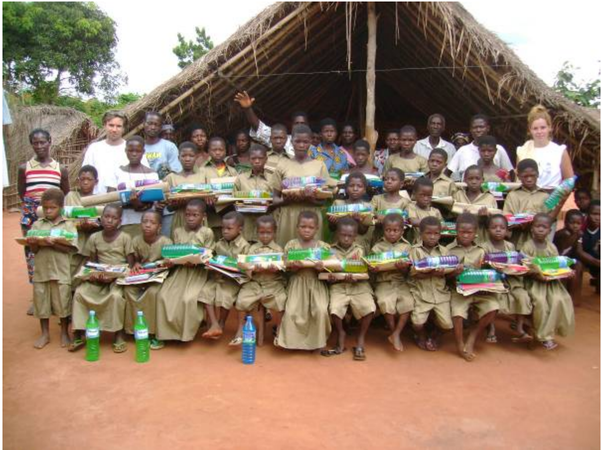
Enfants FES de Hové aussi prêts pour la rentrée 2008