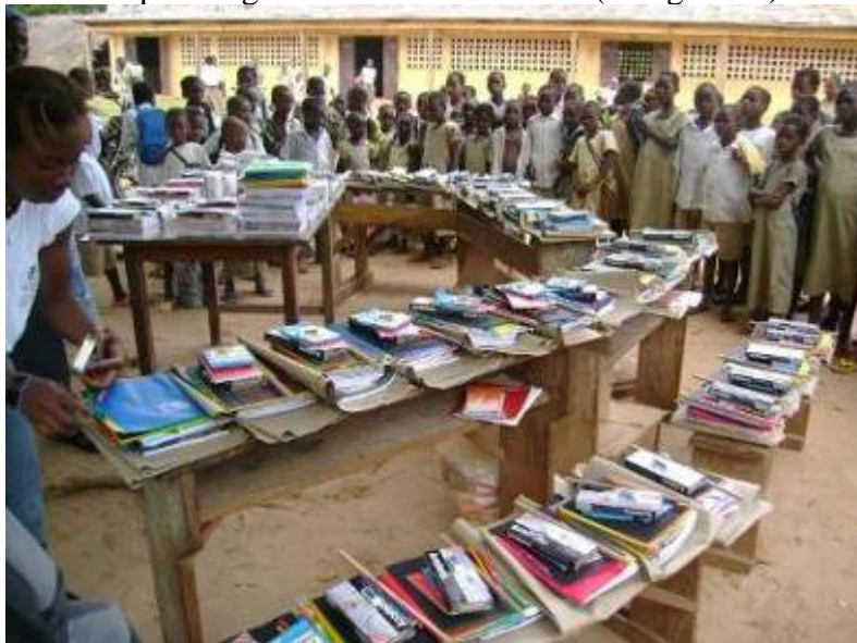
Répartition des fournitures dans le village de Kpomé.