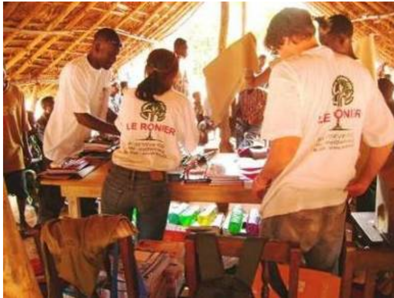
Dispatching des fournitures à Hové (village FES)