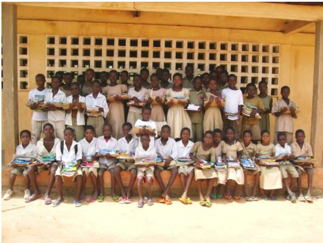
Enfants FES de Kpomé servi pour l'année scolaire 2008 – 2009